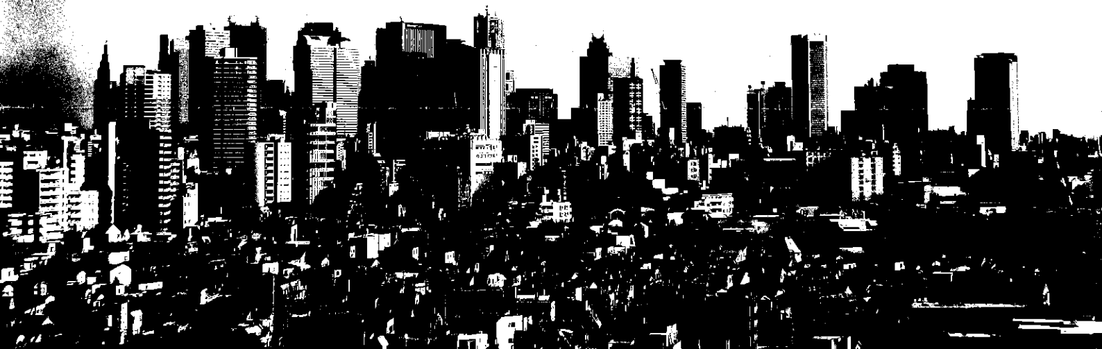
The view from Mejiro University Shinjuku Campus